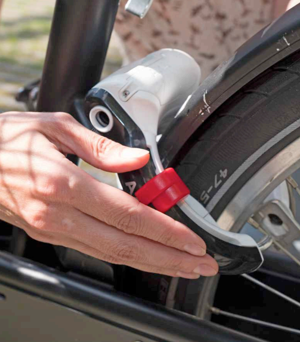
Projekt FindMyBike: Das elektronische Schloss zur Diebstahlsicherung kann vom Fahrer/von der Fahrerin nur über eine App geöffnet werden

mentsysteme herstellt. Die Forschungsschwerpunkte haben die Hochschulen unter sich aufgeteilt. Die Beuth forscht in der Anlagentechnik. Ihr Ansprechpartner ist das Architekturbüro, das bei der Erfassung und Modellierung der baulichen Strukturen und der Aufbereitung für 3D-Simulationen unterstützt. Strömungs- und Temperaturverteilungen werden graphisch abgebildet. Mit diesen Modellen ist es möglich, den Einfluss der Anlagenkonfiguration und der Regelstrategien auf den Gebäudebetrieb zu untersuchen und Teilergebnisse bereits im Vorfeld abzuschätzen.