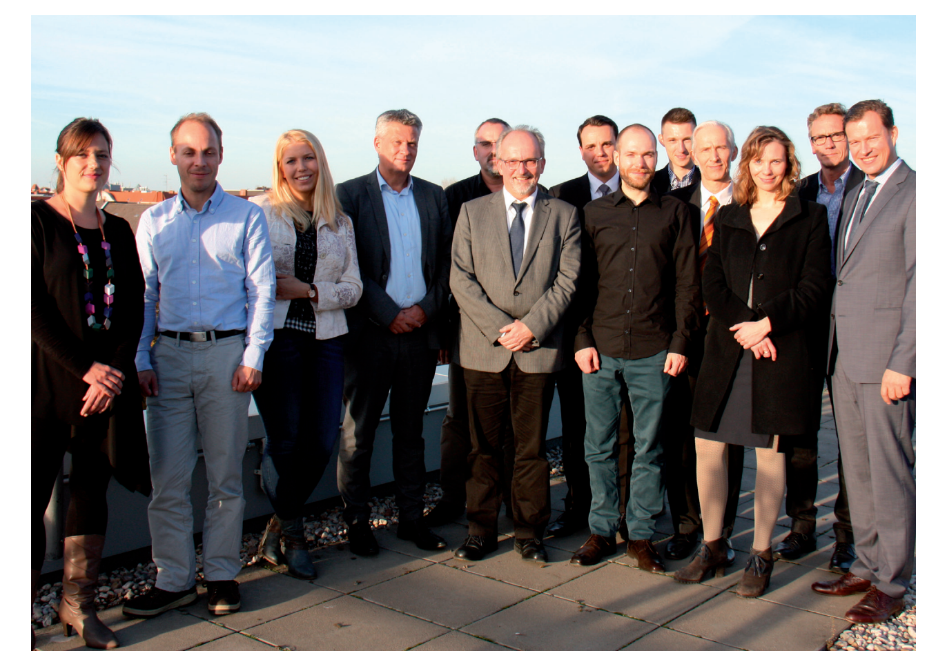
Forscherteam und Praxispartner

Entwickelt wird ein Instrument (eine Cockpitsteuerung basierend auf Heuristiken), das als Grundlage für Entscheidungen im Energiemanagement dient. Dadurch kann der Energieverbrauch in öffentlichen und privaten Nichtwohngebäuden deutlich gesenkt werden.